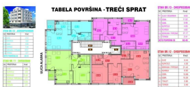
TABELA POVRŠINA - TREĆI SPRAT