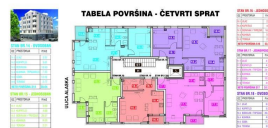
TABELA POVRŠINA - ČETVRTI SPRAT