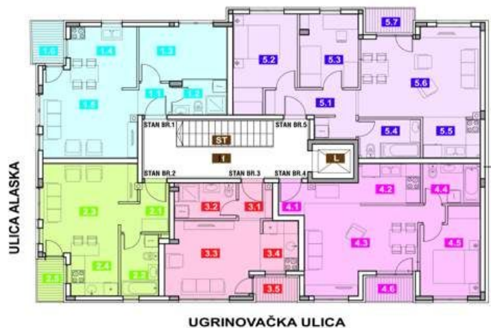
STAN BR.3 - GARSONJERA